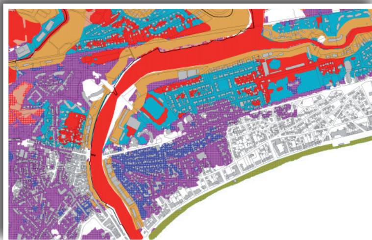
Extrait du zonage réglementaire de la Baule / Le Pouliguen

Il s'agit des zones bleues et violettes.