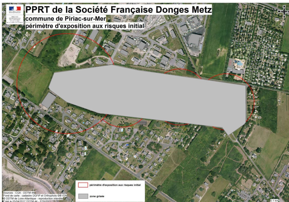
Carte 1 : Périmètre d'étude du PPRT

Sur la base des éléments fournis et après validation des engagements pris par l'exploitant pour la mise en place des mesures de maîtrise de risques tel que présenté au point 3.2.3., l'inspection des installations classées a définitivement arrêté la liste des phénomènes dangereux retenus pour l'élaboration du PPRT. Cette liste est présentée en annexe 1 du présent document. Elle détermine le périmètre d'exposition aux risques.