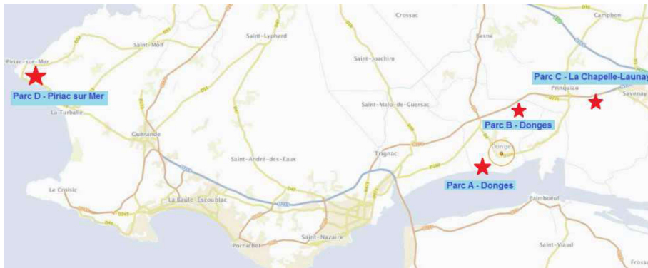
Figure 1 : Implantation des parcs de stockage de liquides inflammables

Un quatrième parc (parc C) exploité par le Service des essences des armées (SEA), est connecté au parc B. Il est situé sur la commune de La Chapelle Launay. La figure suivante présente la localisation des quatre parcs implantés dans le département de la Loire Atlantique.