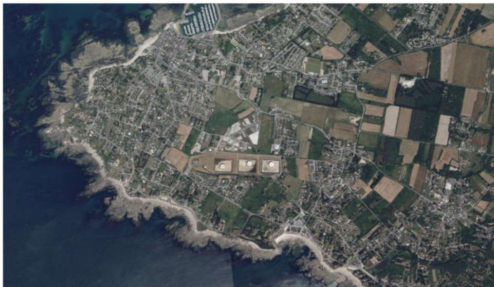
Figure 2 : Localisation du parc de stockage

Actuellement les bacs servent au stockage aux seuls hydrocarbures liquides de catégorie C. Les produits stockés sont des gazoles et des fuels domestiques. La capacité de stockage est d'environ 48 000 m 3 répartie dans des 3 bacs aériens.