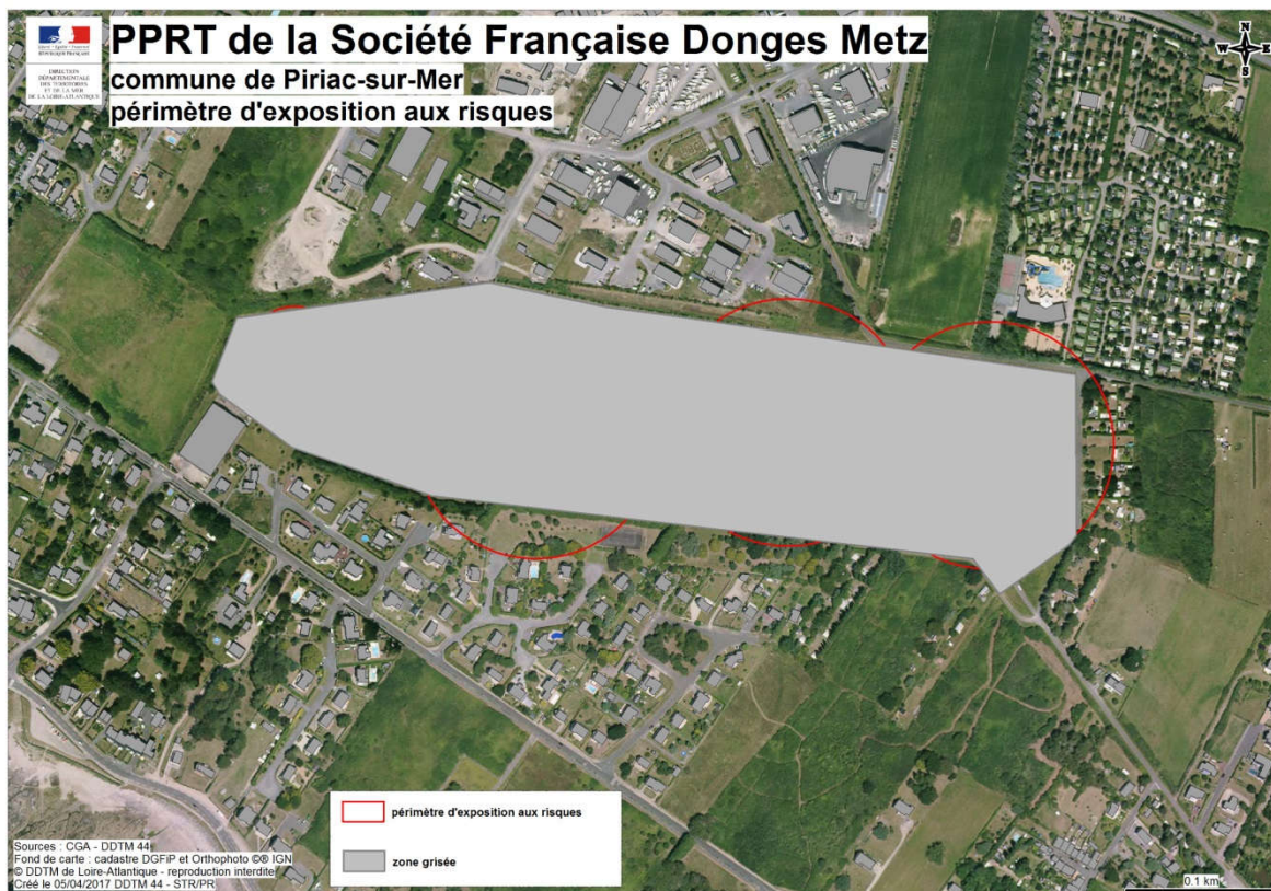
Carte 2 : Périmètre d'exposition aux risques