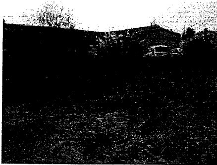
face 5 rue des carrières.JPG 1584K

Nad < shabushabu@club-internet.fr > À : enquete.zac.laregripiere@gmail.com