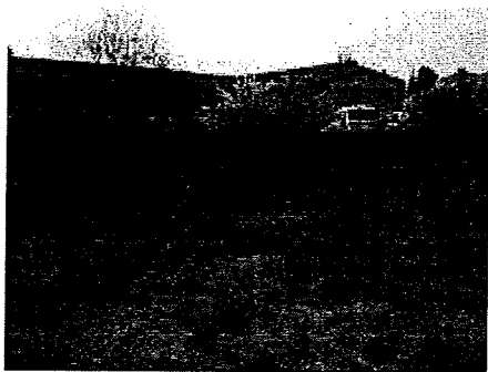
face 5 rue des carrières.JPG 1584K