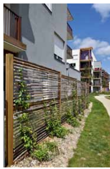
Préservation de l'intimité des jardins privés