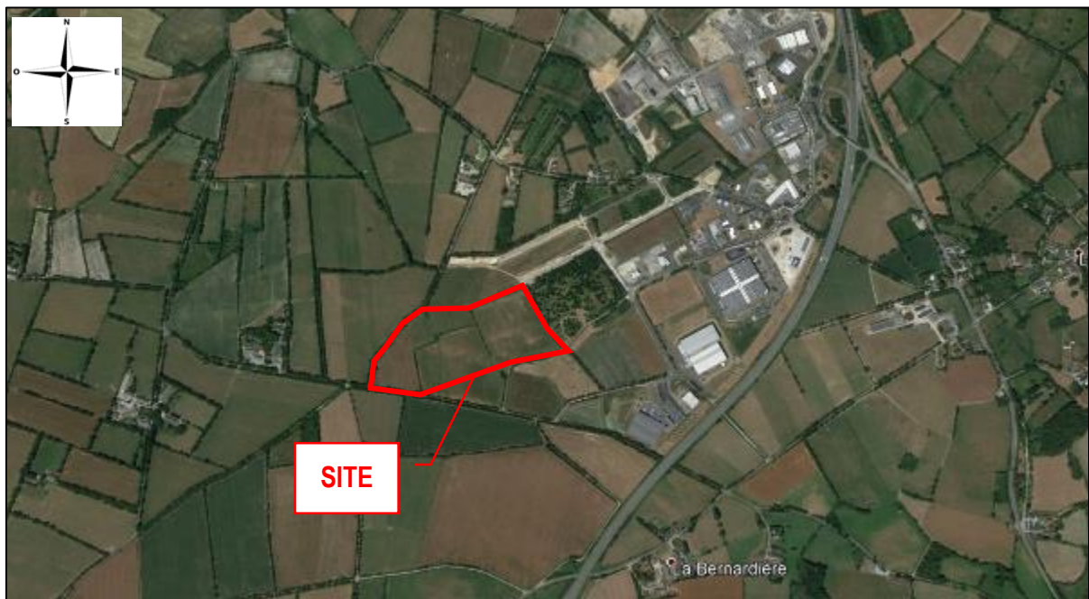
Figure 1 : Localisation du projet