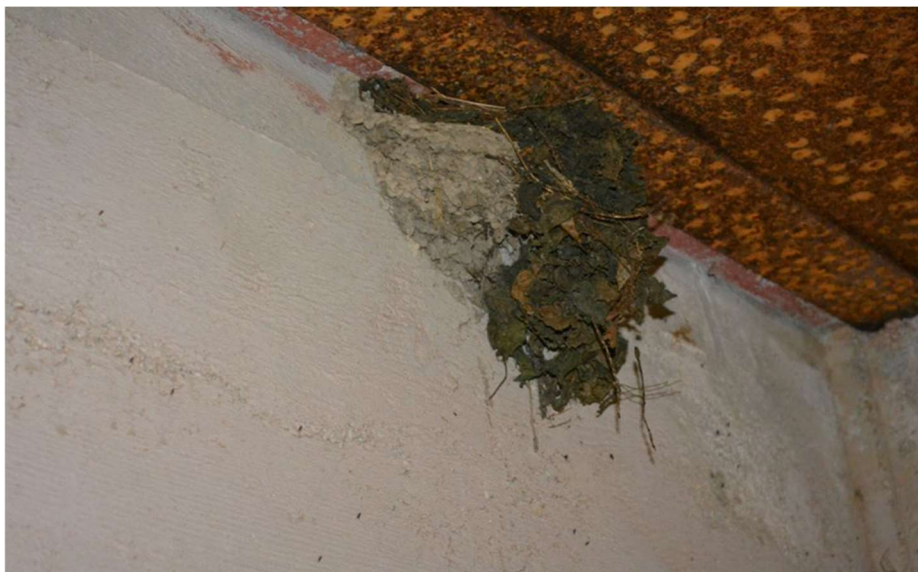
Photo 4 : Nid d'hirondelle à l'intérieur d'un blockhaus, confectionné avec boue traditionnelle (partie grise) et boue mélangée avec de la bouse de vache (partie verdâtre).