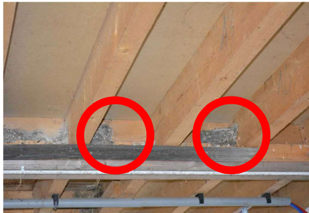
Photo 5 : Exemples de nids d'hirondelle installés dans le local de transformation devant être détruit

Après le début des travaux en janvier 2022, de nouvelles poutres en bois seront réinstallées dans le bâtiment attenant et propice à la nidification des hirondelles. Par la suite des nids artificiels adaptés à l'espèce seront disposés sur le bâtiment