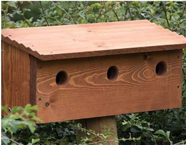
Photo 10 : Exemple de nid artificiel approprié pour le Moineau domestique.

La destruction de 20 nids, sera compensée par la mise en place d'une trentaine de nichoirs sur le bâtiment rénové avant le printemps 2022. Par ailleurs, la ferme offre un potentiel de nidification important pour le Moineau domestique. Ainsi, les moineaux nichent actuellement dans les structures du bâtiment principal qui ne sera pas détruit, mais aussi dans les anfractuosités des murs des différents bâtiments de ferme. Afin de maintenir la population de moineaux sur la ferme au cours de l'hiver 2021, il est prévu la mise en place de mangeoires avec l'objectif de favoriser la nidification au printemps 2022.