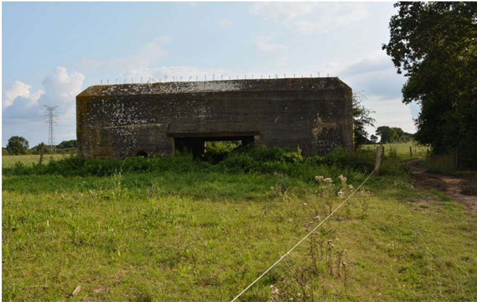
Photo 3 : blockhaus situé à proximité immédiate de la ferme où des nids d'hirondelles sont déjà présents.

Les hirondelles rustiques nichent dans les bâtiments. Quinze couples sont présents sur le site de la ferme et au moins 15 autres couples ont niché en 2021 sur un groupe de 5 blockhaus à moins de 200 m de la ferme. Il semble raisonnable de penser qu'après la phase de travaux au printemps 2022, une partie des oiseaux de la ferme va se reporter dans les blockhaus.