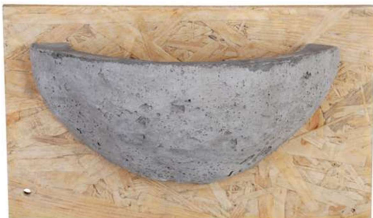
Photo 6 : Exemple de nid artificiel approprié pour l'Hirondelle rustique

Après le début des travaux en janvier 2022, de nouvelles poutres en bois seront réinstallées dans le bâtiment attenant et propice à la nidification des hirondelles. Par la suite des nids artificiels adaptés à l'espèce seront disposés sur le bâtiment