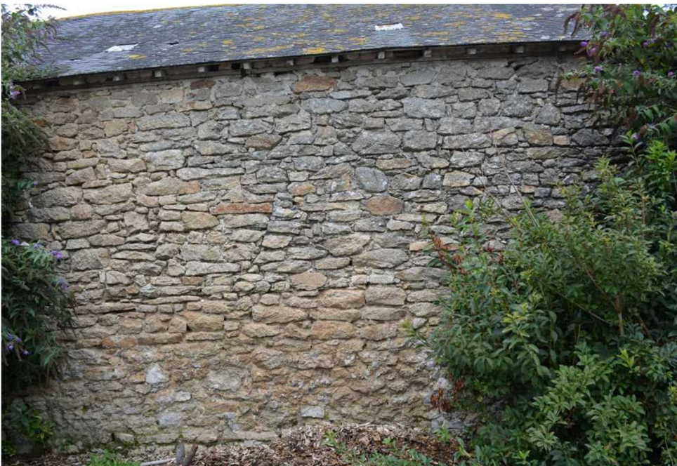
Photo 9 : Prolongement de la même façade qui abrite une autre partie de la colonie.

Le plus gros de la colonie de Moineaux nichent sous la bordure de la toiture visible sur la figure 6.