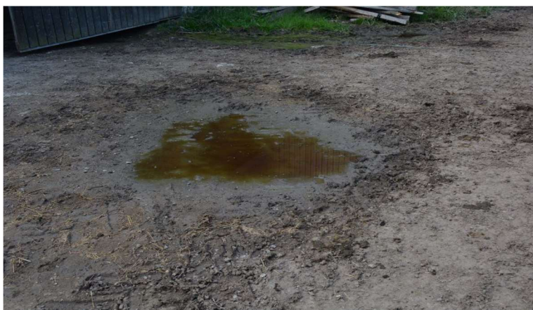
Photo 7 : Exemple de boue disponible pour la construction des nids (très nombreuses zones de passage du troupeau).