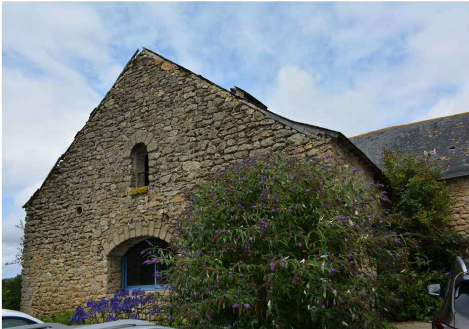
Photo 8 : Portion de façade dans laquelle une partie de la colonie de Moineau domestique niche

Les moineaux dans les anfractuosités de la façade en pierre du bâtiment dont la toiture doit être changée.