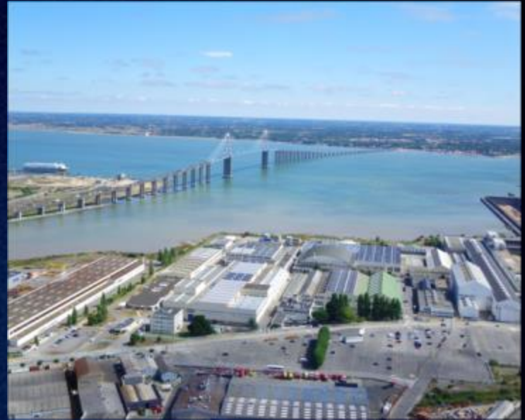
ETABLISSEMENT DE SAINT-NAZAIRE