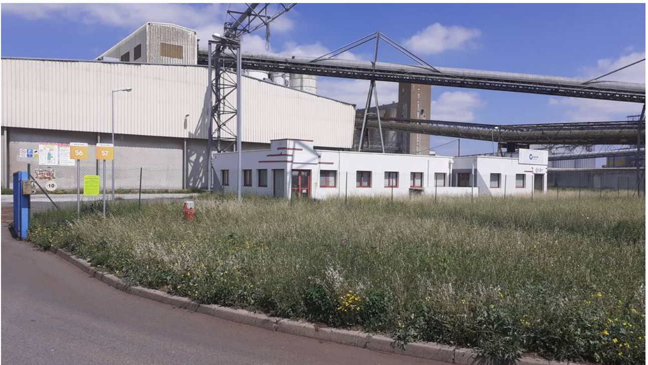
Le site de la société EQIOM rue du Cotré à Montoir-de-Bretagne

Enquête publique du 30 juin 2021 au 16 juillet 2021 inclus